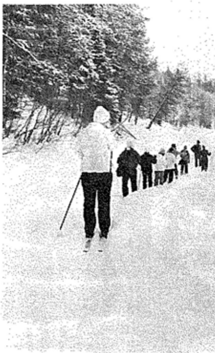
Oulanka-joen lumista maisemaa

Kaksi vuotta ehti vierähtää siltä, kun OYHY:läiset viimeksi piirtelivät latuja Oulanka-joen jylhissä maisemissa. Hiihtelimme kahden päivän ajan Oulangan biologisen aseman lähiympäristössä; kovakuntoisimmat ehtivät molempina päivinä Taivalkönkään autiotuvalle, yli 20 km edestakaisin. Maisemista ja kevätauringosta nauttivat kaikki kolmisenkymmentä matkalaista. Näin sen kokivat kaksi mukana ollutta.