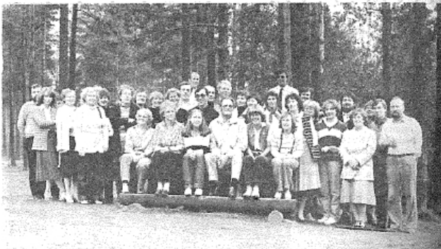
Kiitokset ryhmälle, matkanjohtajalle ja kulljettajalle: